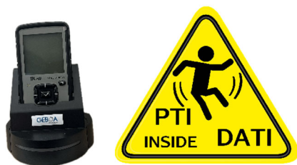
Figure 3 : Dispositif d'Alarme pour Travailleurs Isolés (DATI) disponible à Unimail

En cas d'urgence, la personne travaillant seule appellera à l'aide au moyen du bouton d'alarme du DATI (Figure 3). Ce bouton déclenchera l'appel pour les secours automatiquement.