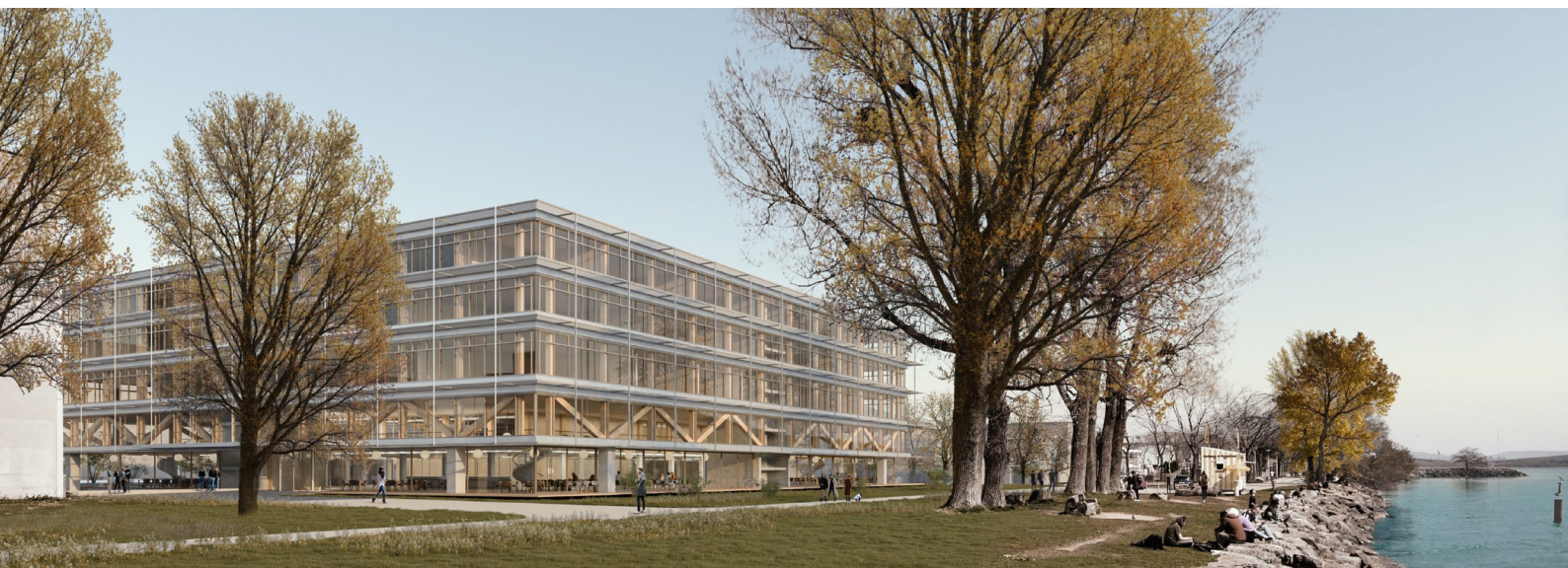
Le projet lauréat du concours d'architecture pour le nouveau bâtiment de l'Université : Univers par le bureau Berrel Kräutler Architekten.

En février, le lauréat du concours d'architecture pour le nouveau bâtiment universitaire est dévoilé. Le projet retenu est celui qui correspond le mieux aux souhaits de l'UniNE et de l'Etat en matière de durabilité. Durant les mois qui suivent, l'Université est continuellement impliquée dans le développement du projet. Elle s'assure entre autres que les aspects environnementaux sont considérés, notamment en matière de matériaux de construction (y compris leur fin de vie), de normes énergétiques et d'efficacité pour le chauffage et la gestion du froid. Le nouveau bâtiment sera conforme aux exigences du standard Minergie P. Bien que le label SNBS (Standard de construction durable suisse) ne soit pas retenu comme objectif par le maître d'ouvrage, une analyse des critères a été effectuée et les principes de construction durables ont été intégrés dans le processus de planification.