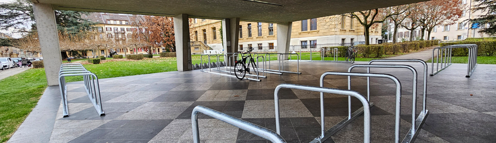
Nouveaux aménagements mobiles pour le stationnement deux-roues au bâtiment Breguet 1.