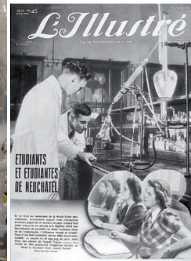
Page de couverture de L'Illustré du 10 novembre 1938, célébrant le centenaire de l'Académie.