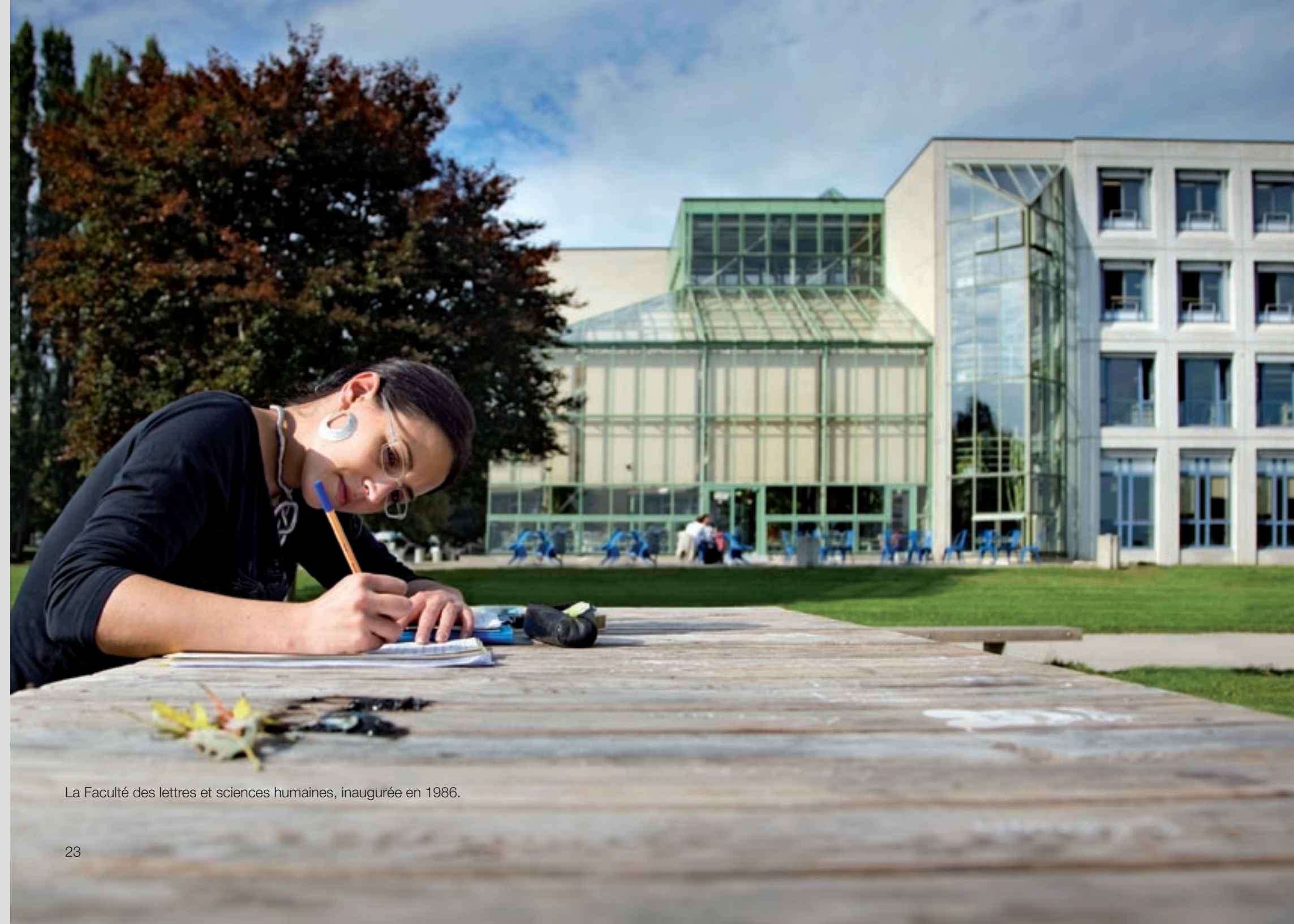
La Faculté des lettres et sciences humaines, inaugurée en 1986.

Neuchâtel est contrainte, vers la fin des années 1990, tant de se profiler que de diffuser un esprit d'entreprise dans la conduite de son développement. Et la nouvelle Loi sur l'Université de 1996 va bien dans ce sens, en accordant désormais une « enveloppe budgétaire » à l'Alma Mater et en renforçant le rôle du rectorat. Responsabilité, autonomie, priorités, concurrence s'insinuent dans le vocabulaire.