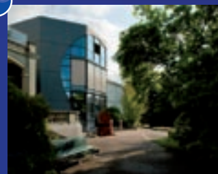
Musée d'ethnographie et Institut d'ethnologie