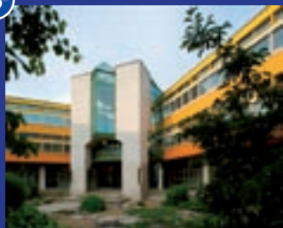
Faculté des lettres et sciences humaines