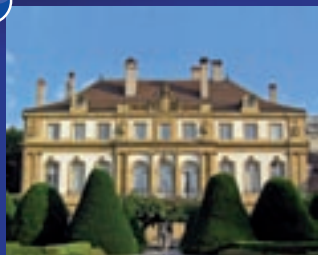
Centre international d'étude du sport (CIES)