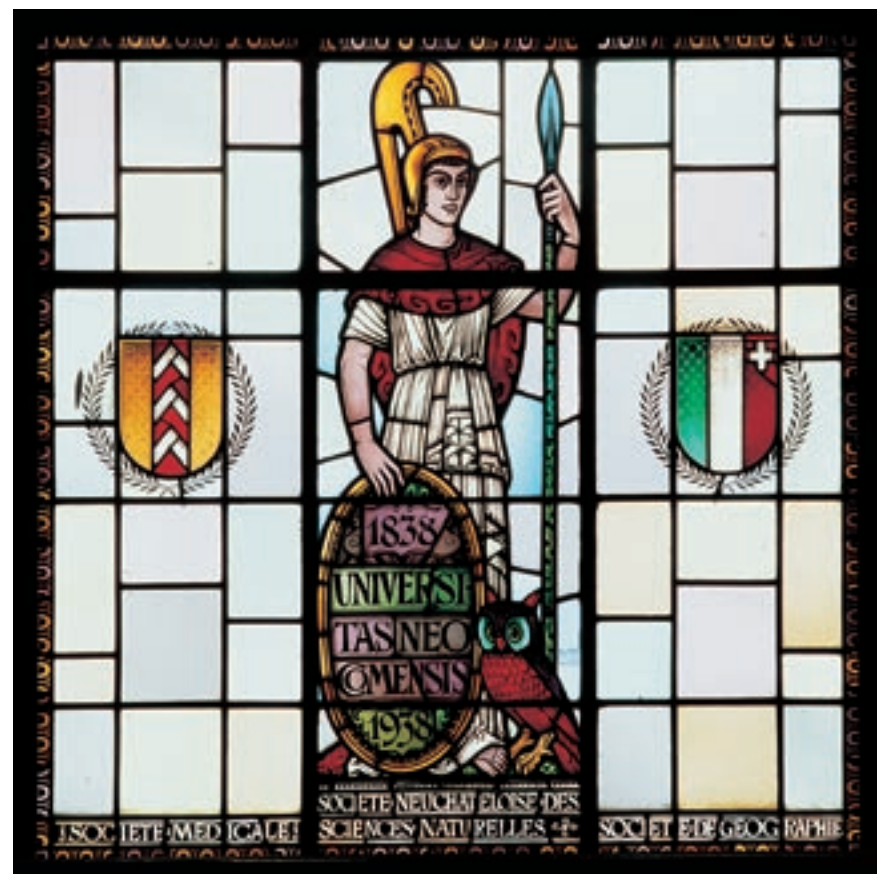
Vitrail offert à l'Université de Neuchâtel à l'occasion du centième anniversaire de l'Académie.