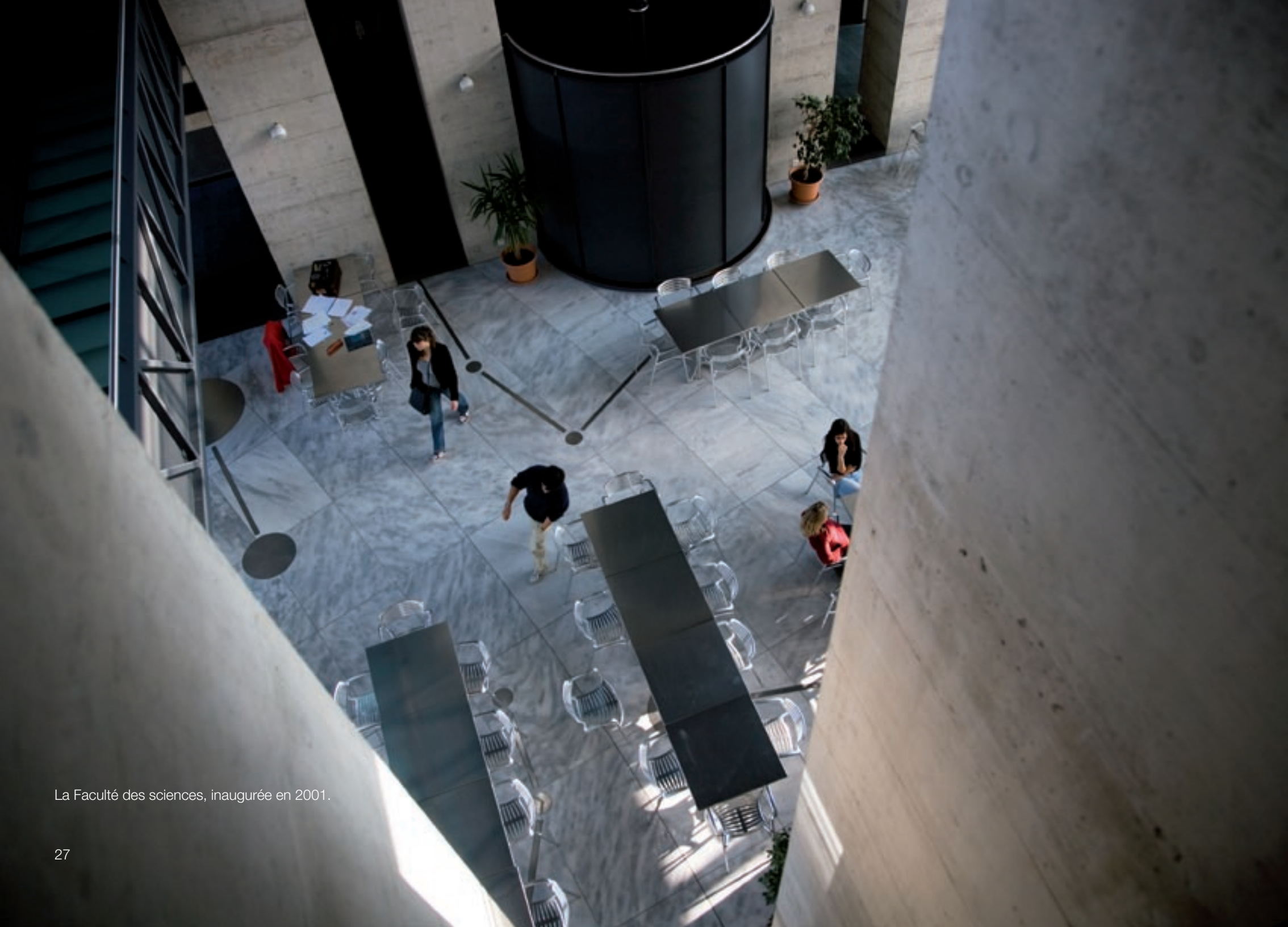
La Faculté des sciences, inaugurée en 2001.

L'Université de Neuchâtel fête aujourd'hui son centième anniversaire. Petite elle était, petite elle est, mais sa vivacité et sa pugnacité acquises au fil du temps lui seront sans doute nécessaires pour affronter les défis de demain.