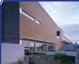
Laténium et Institut d'archéologie