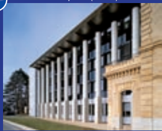
Faculté des sciences