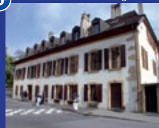
Institut de langue et civilisation françaises