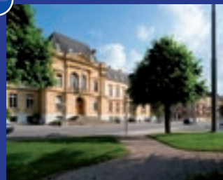
Faculté de droit et Faculté des sciences économiques