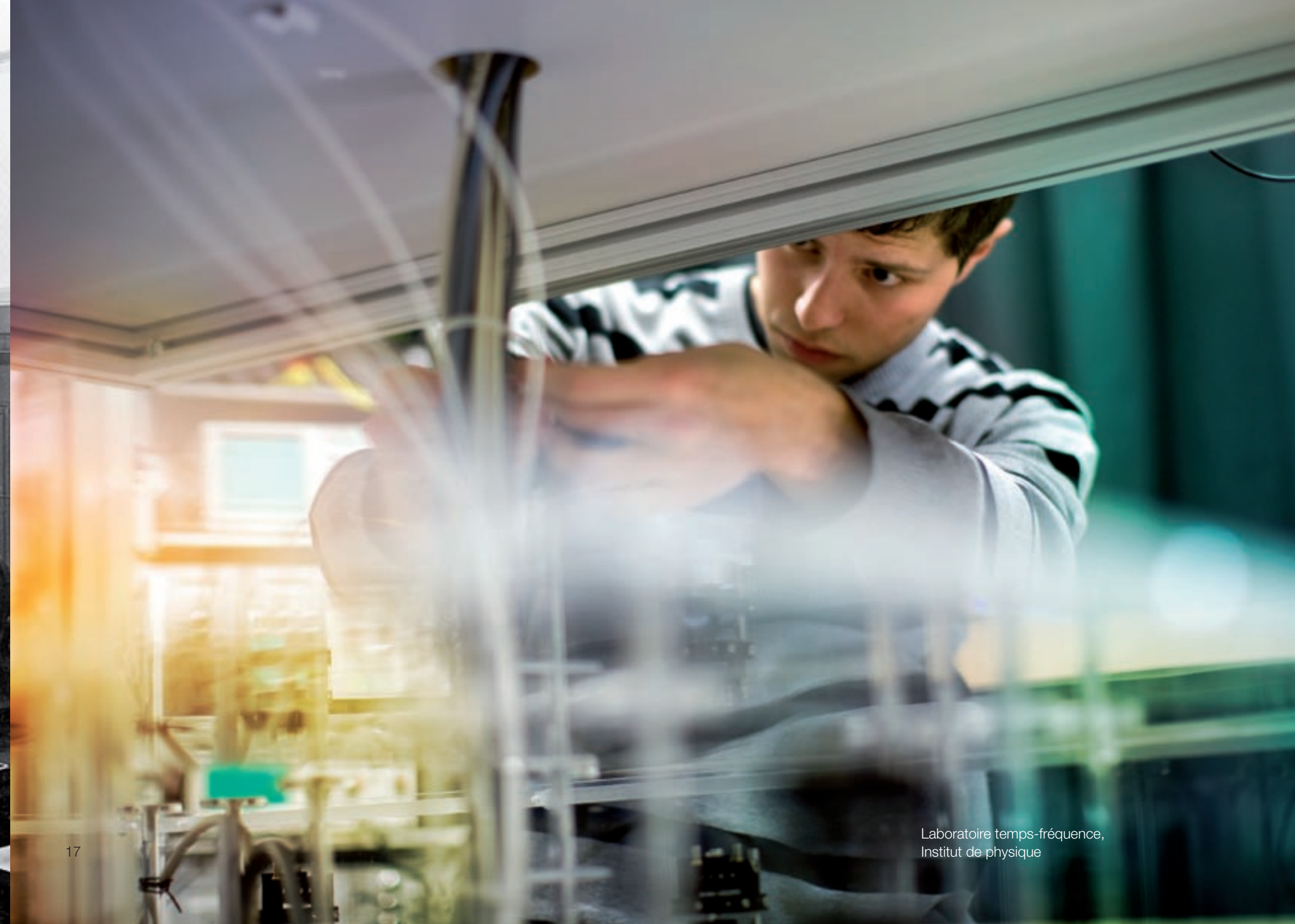
Laboratoire temps-fréquence, Institut de physique