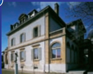
Faculté de théologie