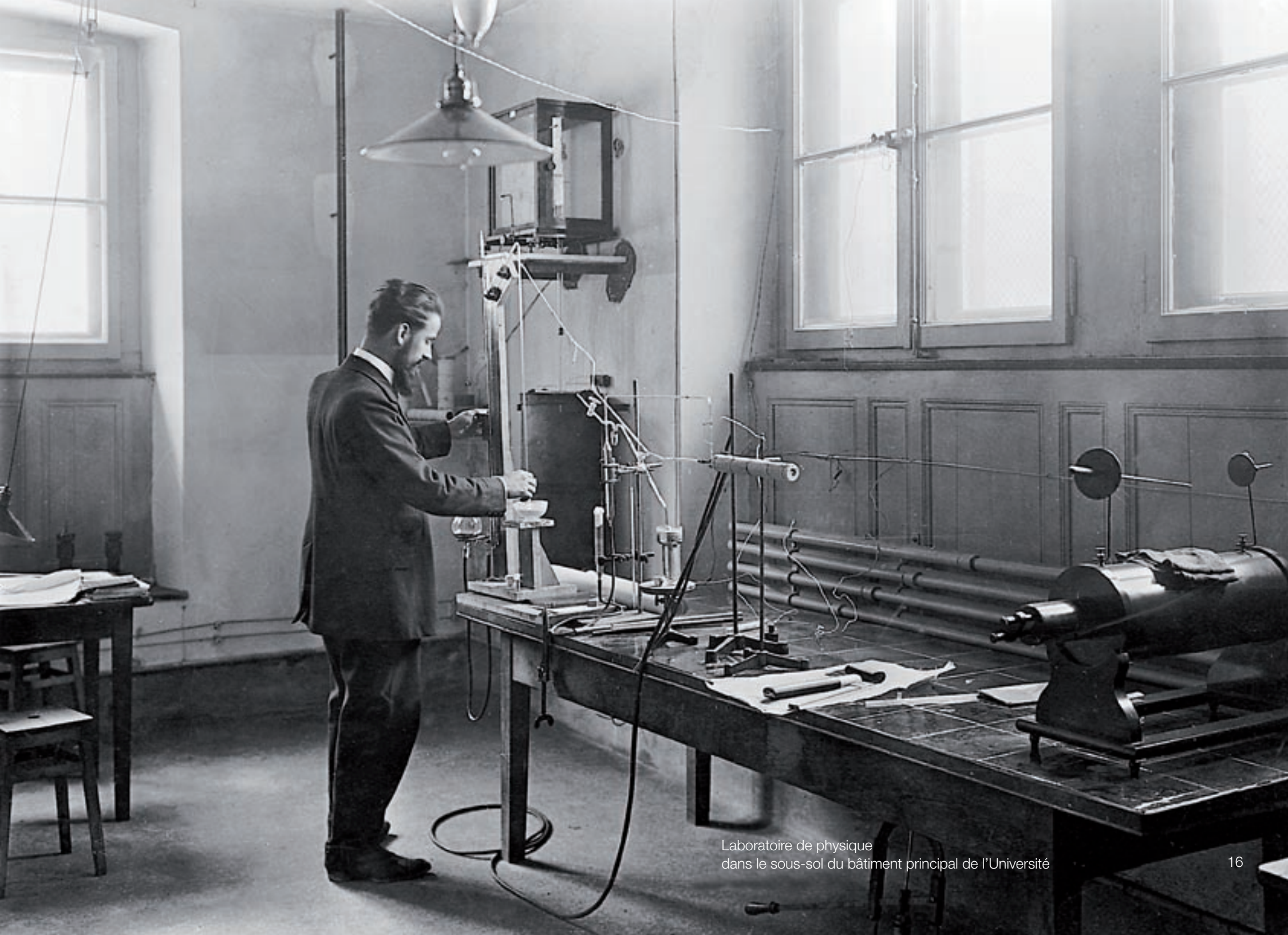
Laboratoire de physique dans le sous-sol du bâtiment principal de l'Université