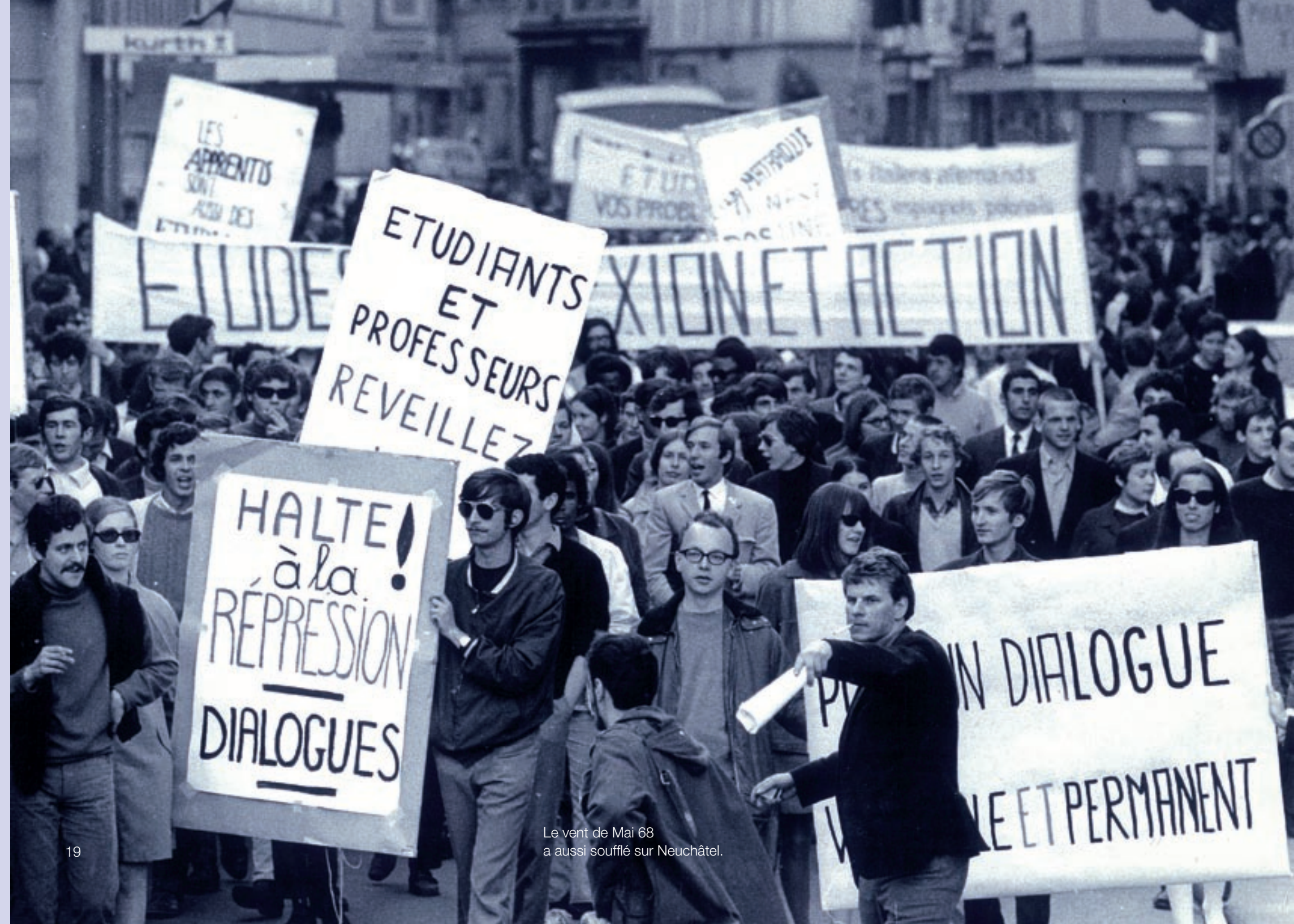
Le vent de Mai 68 a aussi soufflé sur Neuchâtel.

L'Université de Neuchâtel de 1959 à 1979